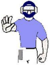
DO NOT PITCH