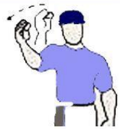
STRIKE OR OUT