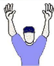
TIME-OUT, FOUL BALL, DEAD BALL

Da es in einem Baseballstadion auch sehr laut werden kann, benutzen die Umpire neben verbalen Entscheidungen auch Handsignale.